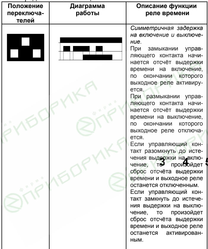
Продолжение таблицы 2