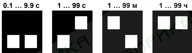
Рисунок 4 – Положения переключателей для задания диапазона выдержки времени

5.4 Положения переключателей для выбора диапазона задания выдержки времени в соответствии с рисунком 4.