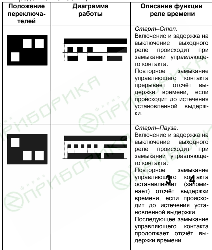
Продолжение таблицы 2