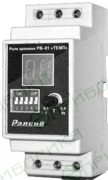
Рисунок 1 – Внешний вид реле времени РВ-01 «ТЕМП»