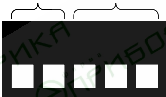
Рисунок 2 – Расположение переключателей реле времени РВ-01