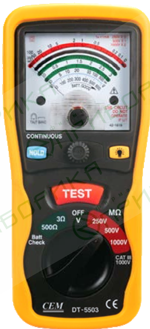
DT – 5503